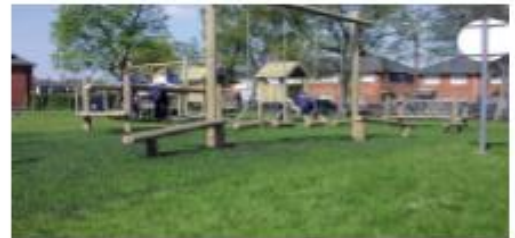
OBS: Tolerancer på dimensionerne kan forekomme